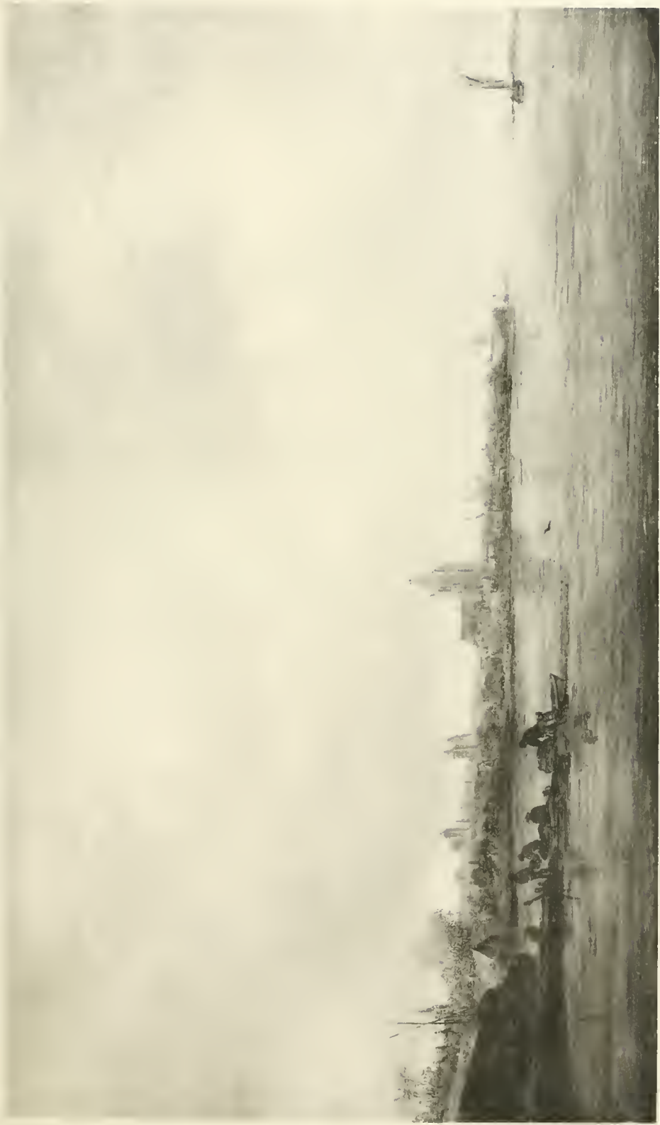
J. VAN GOYEN